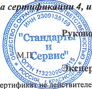
схема сертификации 4, инспекционный контроль: 2025 год, 2026 год

Сочинского филиала ФБУЗ «Центр гигиены и эпидемиологии в Краснодарском крае»